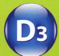
Vitamin D 3